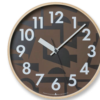
AWA19-12 BW ブラウン 4515030076544