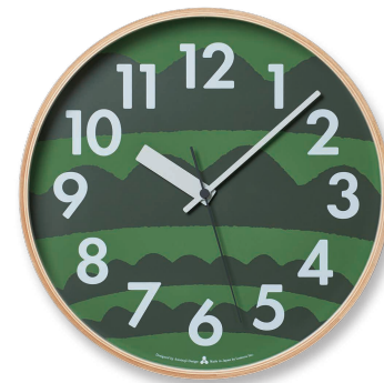
AWA19-12 GN グリーン 4515030076537