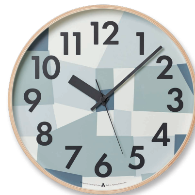
AWA19-11 BL ブルー 4515030076513