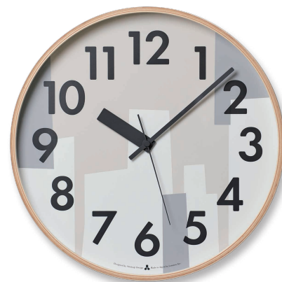
AWA19-11 BG ベージュ 4515030076506

サイズ：φ354×d48mm 重量：970g 素材：プライウッド、ガラス 仕様：スweepセコンド 価格：¥11,000（税抜価格¥10,000）