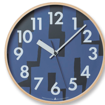
AWA19-12 BL ブルー 4515030076520

サイズ：φ305×d48mm 重量：750g 素材：プライウッド、ガラス 仕様：スweepセコンド 価格：¥8,800（税抜価格¥8,800）