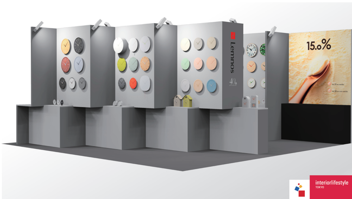
interior lifestyle 2024 イメージCG