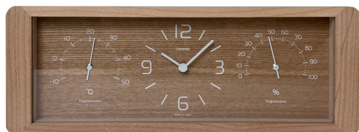
新仕様（アルダー材）