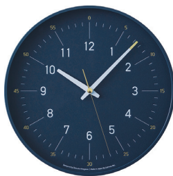
DFI 24-06 NV ネイビー 4515030101925