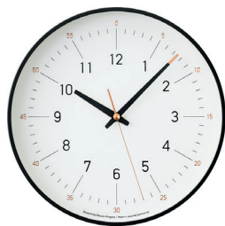
DFI 24-06 WH ホワイト 4515030101918

機能と素材に本質的に向き合うことで生まれたessent は、こどもからおとなまで読みやすく、どんな空間にも馴染みます。