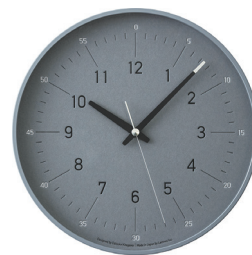
DFI 24-06 GY グレー 4515030101932

寸法: φ256×d46mm 重量: 660g 素材: アルミニウム、紙、アクリル(UVカット) 仕様: スイープセコンド 価格: 22,000円 (本体価格20,000円)